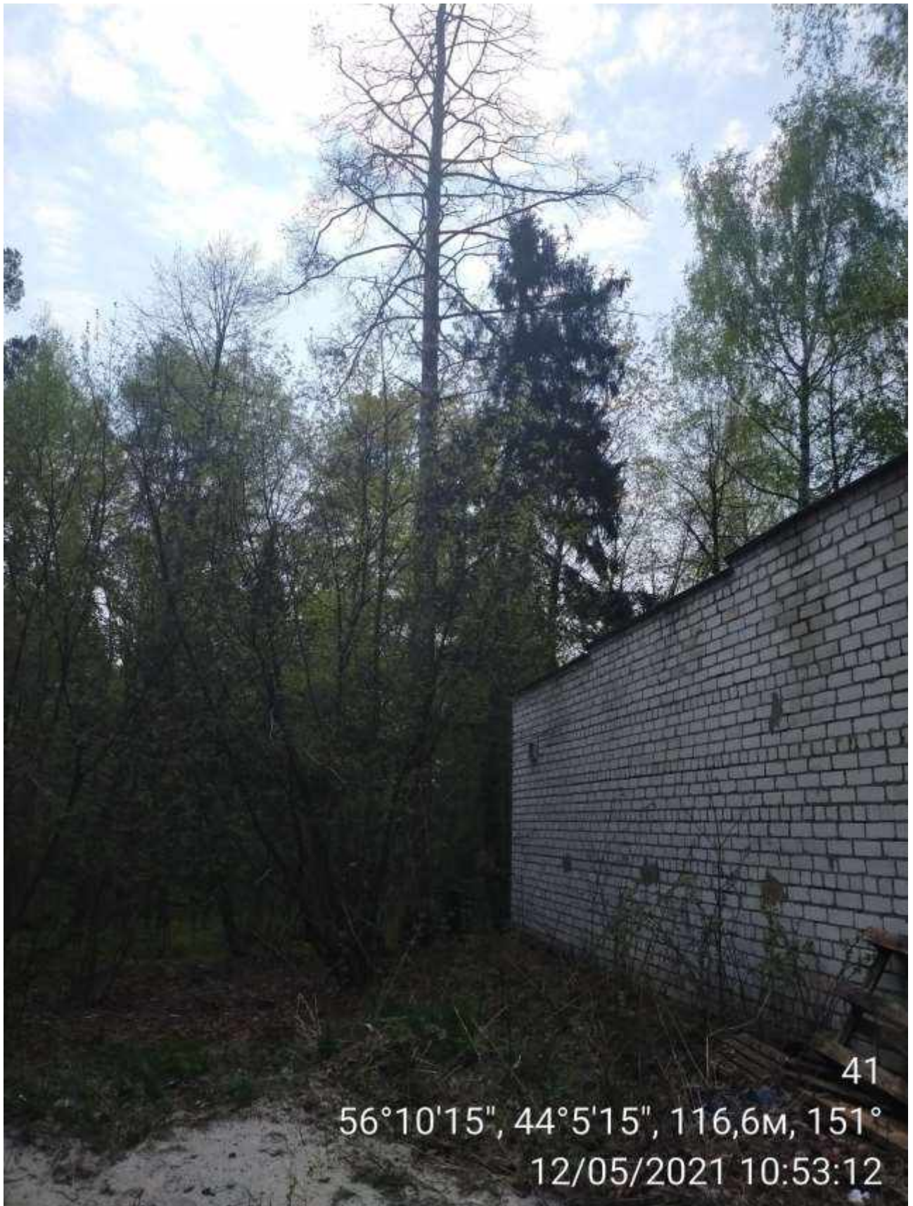
Дерево № 41 (Стволовая гниль)